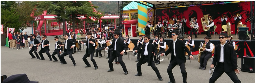
静岡県立小山高等学校吹奏楽部