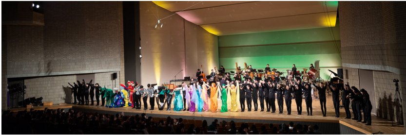
静岡県立沼津商業高等学校吹奏楽部