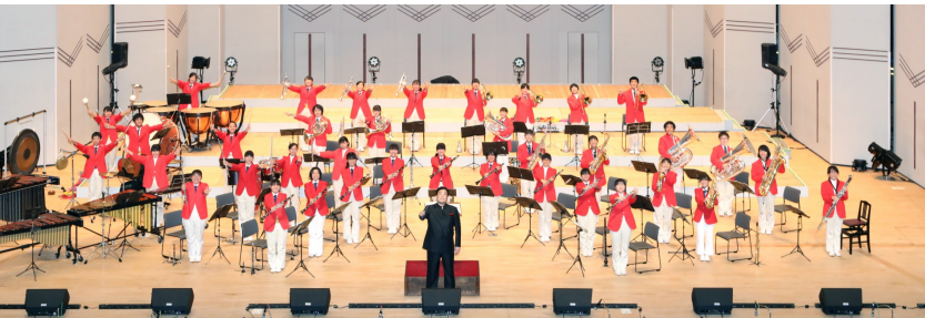
学校法人静岡理工科大学 星陵中学校・高等学校吹奏楽部