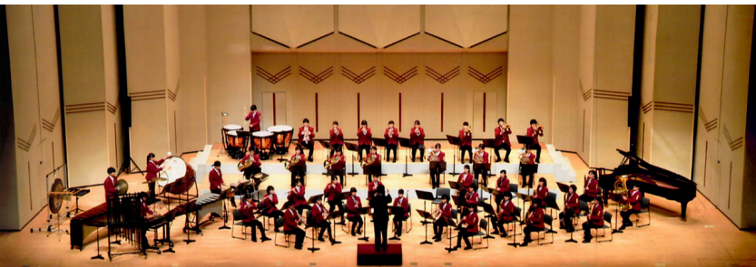
静岡県立沼津西高等学校吹奏楽部